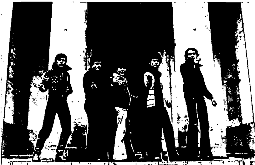
Le Sexe des anges de Lionel Soukaz.

Ces deux scènes, au début et à la fin du film, sont les plus belles, les plus émouvantes, les plus chargées de sens et (donc) d'érotisme. Entre les deux, sur le chemin de l'une à l'autre, le sens se perd et s'égrène à travers le passage en revue des images dans lesquelles la sexualité mâle est enfermée, la mythologie grecque et latine pour l'adolescent, la disponibilité du loulou paumé, le danseur, le marin, le facteur, le plombier, les images hard du porno pour l'homosexuel adulte. Toutes ces images, qui lui sont renvoyées et qui le nient, Bruno se les colle à la peau, s'en travestit, mais aussi s'en protège, et les redouble en tant qu'images par un effet de comique : jouant sur la répétition, sur l'exagération dans la mimique des corps, il accentue l'agitation grotesque et ridicule dont sont saisis les corps et les sexes dans le cinéma porno, la répétition inlassable de la décharge obligée. Mais